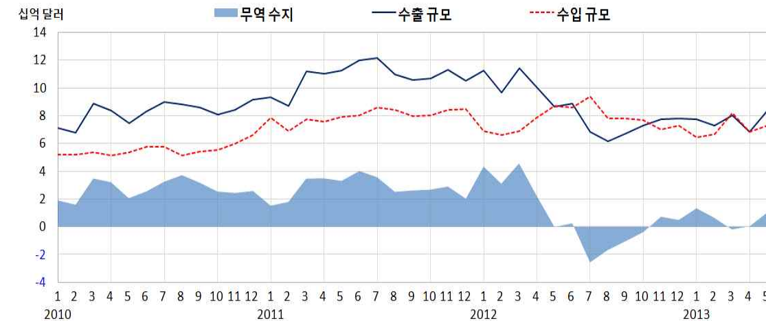
그림 1. 이란의 월간 교역 추이 (2010.1~2013.5)