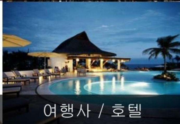
여행사 / 호텔