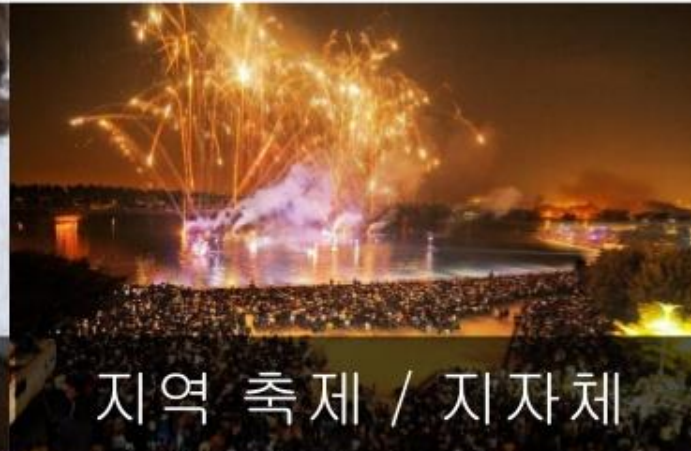
지역 축제 / 지자체