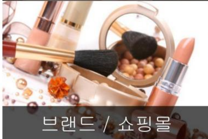
브랜드 / 쇼핑몰