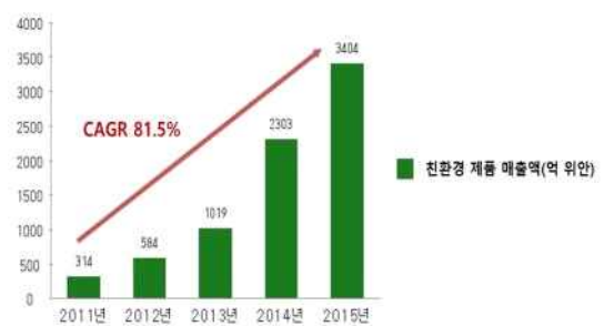
그림2. 중국 녹색 소비액 CAGR