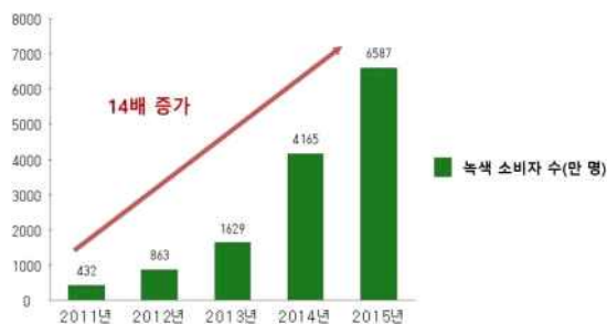
그림1. 중국 녹색 소비자 현황