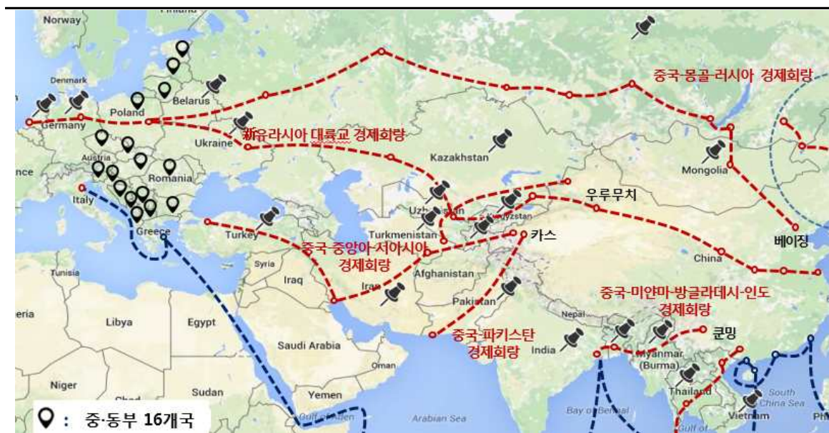
그림 2. 중국 일대일로 경제회랑과 중·동부 16개 유럽국 위치