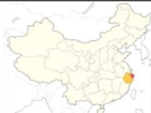
그림 1. 저장성 닝보 위치