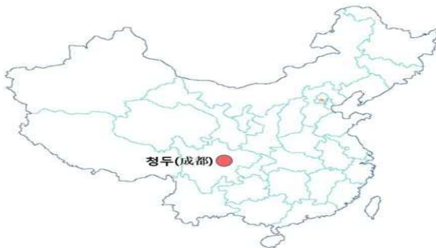
그림 1. 청두시의 위치