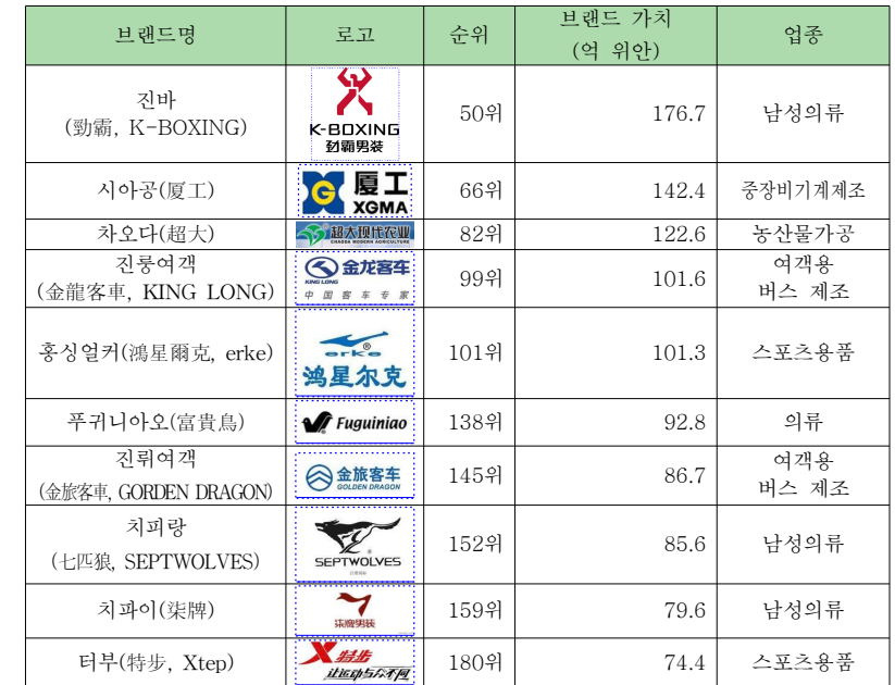
표 2. 중국 500대 브랜드 중 푸젠성 상위 10대 브랜드

주: 홍콩 PIN PAI 그룹이 중국에 세운 의류업체인 PIN핀파이(PIN拼牌)가 160위이나 정확한 정보가 부재하여 생략.