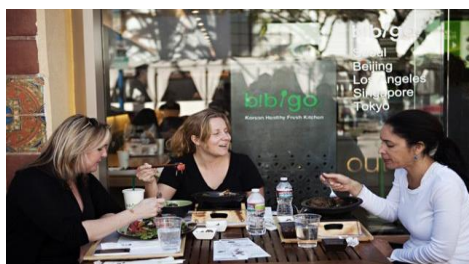
CJ bibigo, England (현 5 개국 14개 매장)