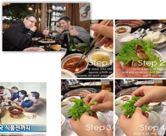
'삼겹살 먹는 법' 안내문 예