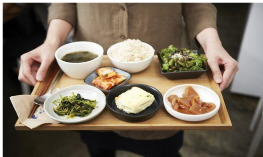
집 밥, Home Cooking