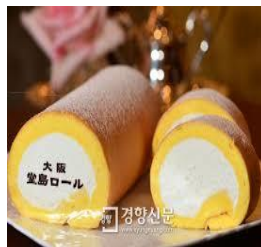
라뒤레 마카롱 / 몽슈슈 롤케익