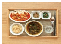
삼치구이정식 10,000 원