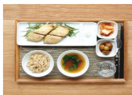
김치찌정식 9,500 원