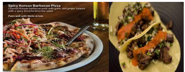
캘리포니아 토틸라(California Tortilla)의 코리안 바비큐