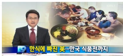
(영국) 한국 레스토랑 수 작년 대비 150% 증가, 한국 식품 수입은 135% 증가