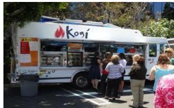
Roy Choi's Kogi Truck , LA : Korean BBQ Taco