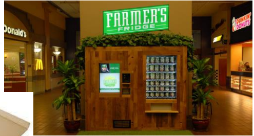
Farmer's Fridge, Chicago

: 신선제품 판매하는 자판기. 문 앞까지의 배달 상품, 조리식품이용 소비자 증가가 레스토랑 업계 성장률 초과