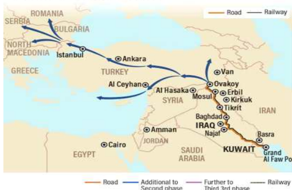
그림 1. 개발도로(Development Road) 경로 지도 DEVELOPMENT ROAD PROJECT