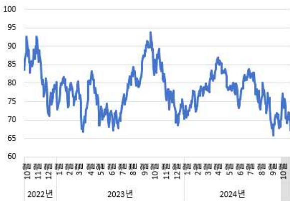
그림 1. 국제유가 추이 (단위: 달러/배럴)